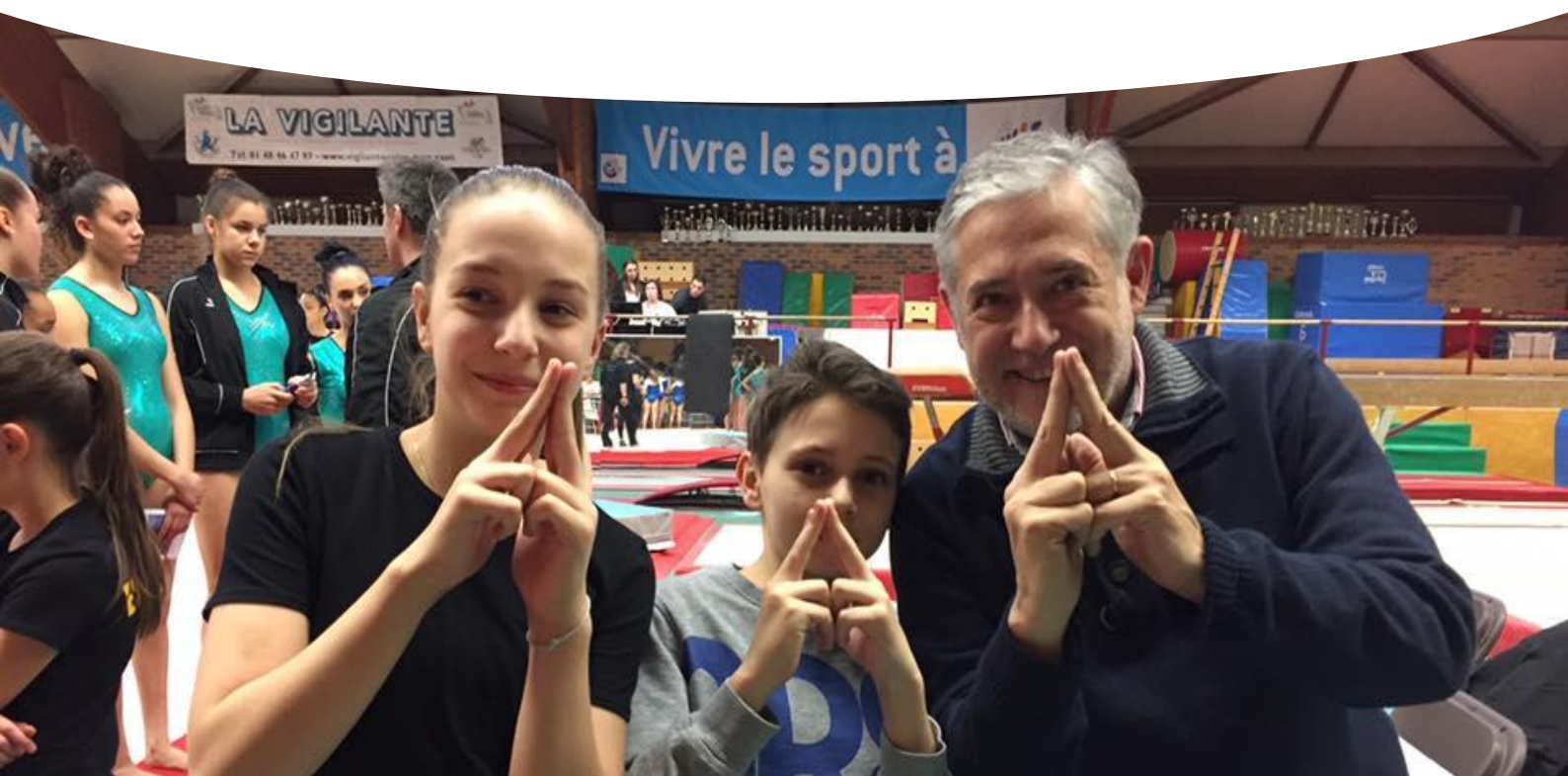
Photo des jeunes en train de réaliser le signe Paris 2024.