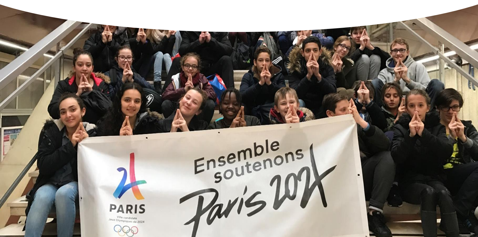
Photo des jeunes en train de réaliser le signe Paris 2024 derrière une banderole Paris 2024.