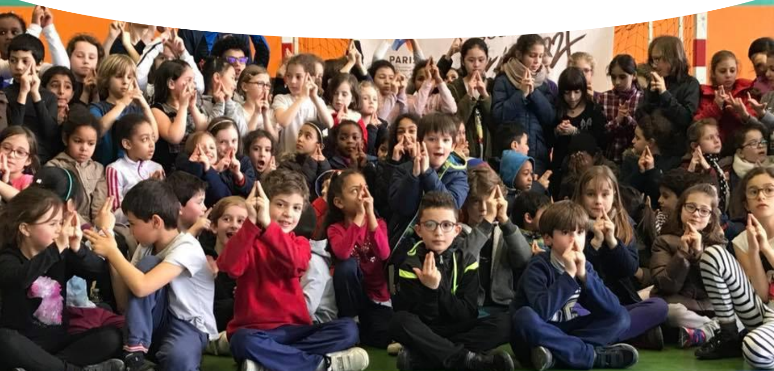
Photo des jeunes en train de réaliser le signe Paris 2024 derrière une banderole Paris 2024.