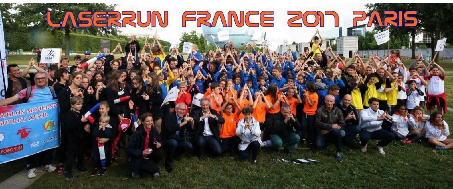
Photo des participants en train de réaliser le signe Paris 2024.