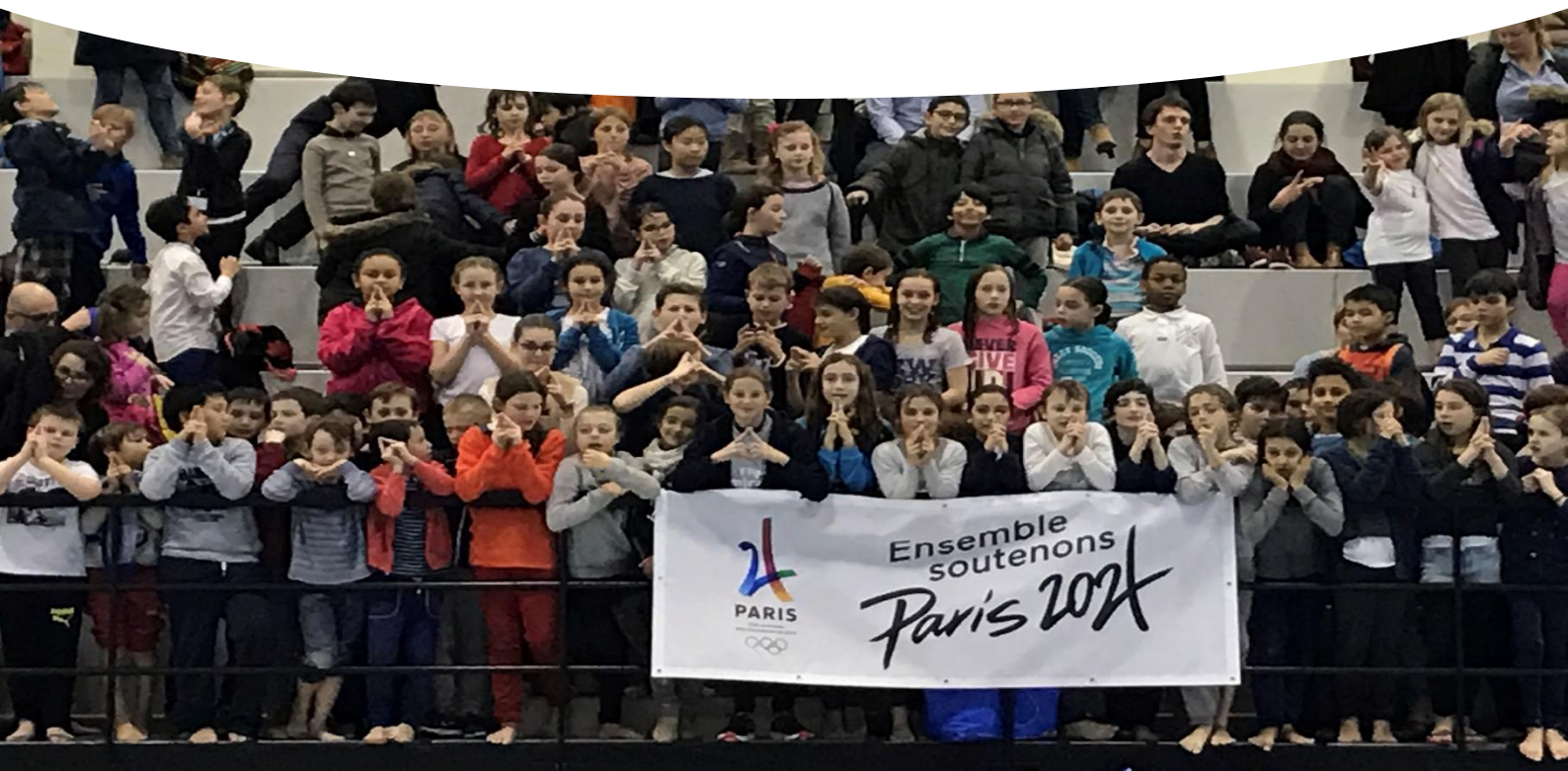
Photo des jeunes en train de réaliser le signe Paris 2024 devant une banderole Paris 2024.