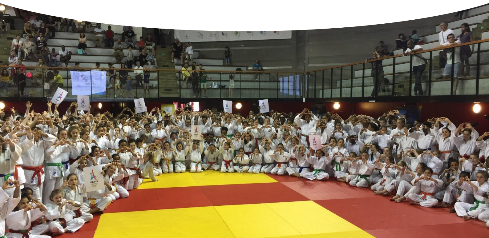
Photo des jeunes en train de réaliser le signe Paris 2024.