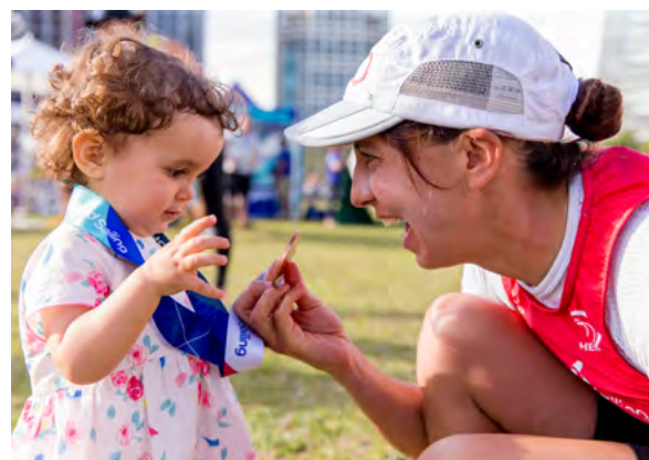
Charline Picon, championne olympique de planche à voile RS :X et maman

« Pendant toute ma grossesse, l'envie de poursuivre le sport de haut niveau était forte, mais j'avais malgré tout ce point d'interrogation sur ce qu'il allait se passer une fois qu'elle serait dans mes bras et aussi si j'allais retrouver mon niveau. Mon préparateur mental m'a fait comprendre que je pouvais déconnecter du sport et de mon projet sportif pendant un moment et me connecter sur ce qui se passait en moi et avec l'enfant que je portais. Ca m'a vraiment libéré. »